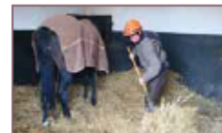
Mettre le box en bateau